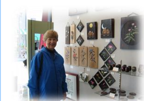
⑧ Wood carving craft shop