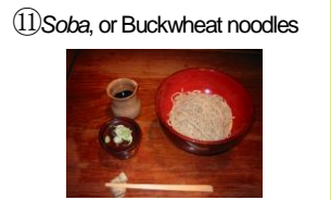
⑪ Soba, or Buckwheat noodles