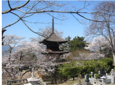
① Zensanji Temple

Ueda is only 90 minutes from Tokyo by Shinkansen bullet train. We are very happy to guide foreign travelers around Ueda. We hope you will have a great time in Ueda with us!