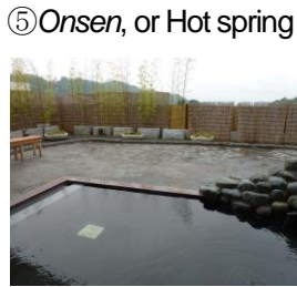
⑤ Onsen, or Hot spring