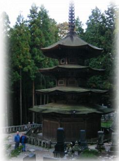
③ Anrakuji Temple National Treasure