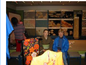
⑦ Kimono shop

Much of the Edo atmosphere has been left behind