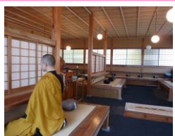
④ Zazen, or Meditation

30 minutes from Ueda station via the Bessho line