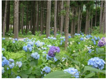
② Walking path