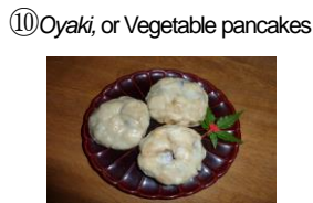
⑩ Oyaki, or Vegetable pancakes